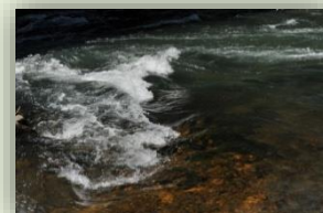
Le Gave de Pau

Pourtant, malgré les nombreux bénéfices qu'elles procurent, les zones humides régressent et on estime généralement que les 2/3 des zones humides originelles françaises ont été détruites. À la base de la disparition de la biodiversité des zones humides, il y a la transformation des habitats (par le drainage et le remblayage pour l'agriculture ou la construction), les changements climatiques, la pollution, la propagation d'espèces « exotiques » - non natives - envahissantes et la surexploitation des ressources.