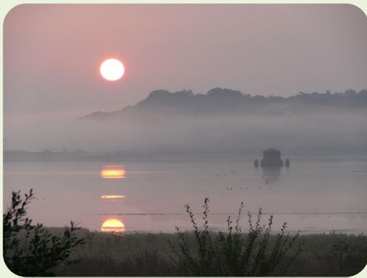
Lever de soleil sur le Marais d'Orx

A ce jour, la France compte 42 sites inscrits sur la liste Ramsar, soit 3 510 000 ha, qui sont ainsi classés d'importance internationale, en métropole et en outre-mer. En 2012 et pour la première fois en Aquitaine, deux zones humides d'importance internationale ont obtenu le label Ramsar, le marais d'Orx et le delta de la Leyre.