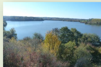
Vue sur le Lac de La Prade