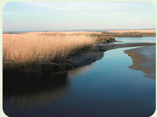
La Leyre – Parc Naturel Régional des Landes de Gascogne