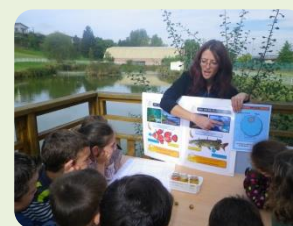
Atelier pédagogique sur le Brochet