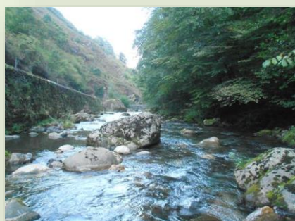
Cours d'eau du Larrau