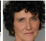
Isabelle Autissier Navigatrice