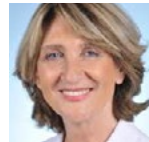
Élisabeth Toutut-Picard Députée Haute-Garonne