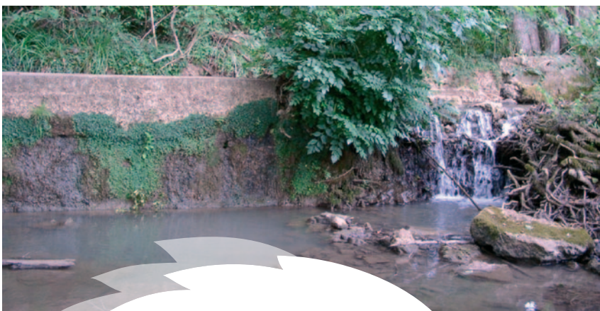
Seuil d'alimentation d'étang : obstacle infranchissable

Les principaux impacts sont les suivants : fragmentation des populations piscicoles, présence de retenues où l'eau s'échauffe, sédimentation dans les retenues, réduction des habitats piscicoles typiques du cours d'eau.