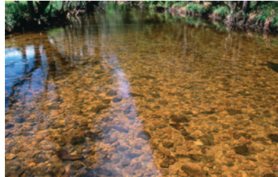
Lit de cours d'eau du Massif central

Fond du cours d'eau non colmaté, eau limpide: nombreux habitats pour les invertébrés, habitat favorable pour les organismes vivant dans le substrat (œufs de salmonidés, jeunes stades de salmonidés, moules perlières...). Ce sont aussi souvent des secteurs astascicoles.