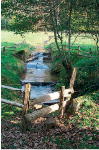
Différents aménagements piscicoles : petits déflecteurs, seuils, blocs de pierre