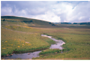
Petit cours d'eau du plateau de l'Aubrac

Selon les secteurs, présence ou non de ripisylve *.