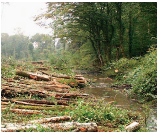
Exploitation d'une coupe forestière jusqu'au bord du cours d'eau