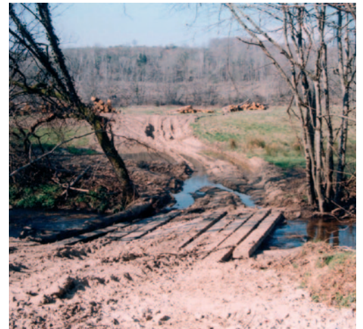
Aménagement pour franchir le cours d'eau

Tout franchissement d'un cours d'eau sans structure adaptée est interdit car il engendre une pollution des eaux par les matières en suspension (art. L 432-2 du code de l'environnement).