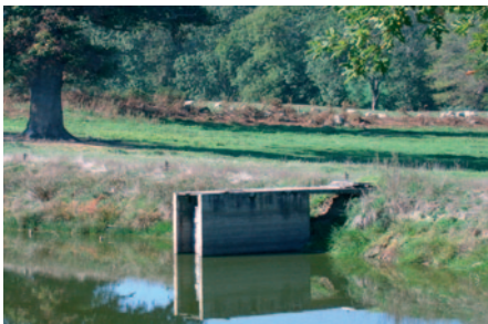
Moine de vidange

Pour les étangs, des modalités de gestion (équipements et pratiques) autorisées par la police des eaux, doivent conduire à limiter les impacts sur le cours d'eau à l'aval :