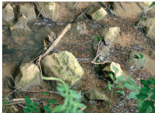
Lit d'un ruisseau colmaté

Sur ces secteurs, où une dynamique hydro-sédimentaire est très souvent importante, il est nécessaire de s'appuyer sur la définition d'un espace de bon fonctionnement du cours d'eau laissant celui-ci effectuer son travail de transport solide et de divagation, facilitant par là même la conservation d'un maximum de diversité des habitats.