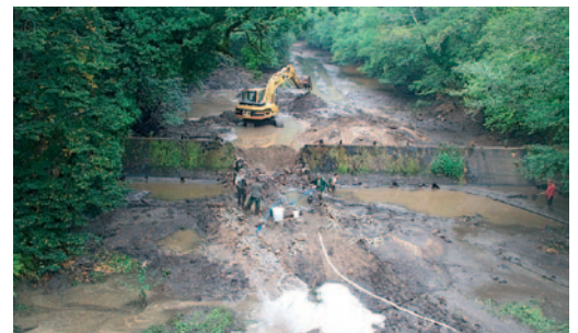
Pêche électrique préalable à l'effacement de la digue de Chambon

L'effacement des seuils est parfois envisageable sans difficulté particulière : c'est la solution à privilégier pour retrouver des tronçons d'eau courante proches du fonctionnement naturel.