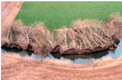
Végétation riveraine non adaptée basculée par la tempête