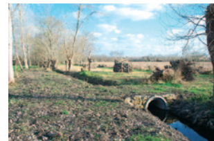
Ouvrage de franchissement d'un fossé