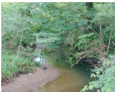
Ripisylve de petit cours d'eau

Lors des crues, le maillage bocager de ces plaines peut ralentir les écoulements .