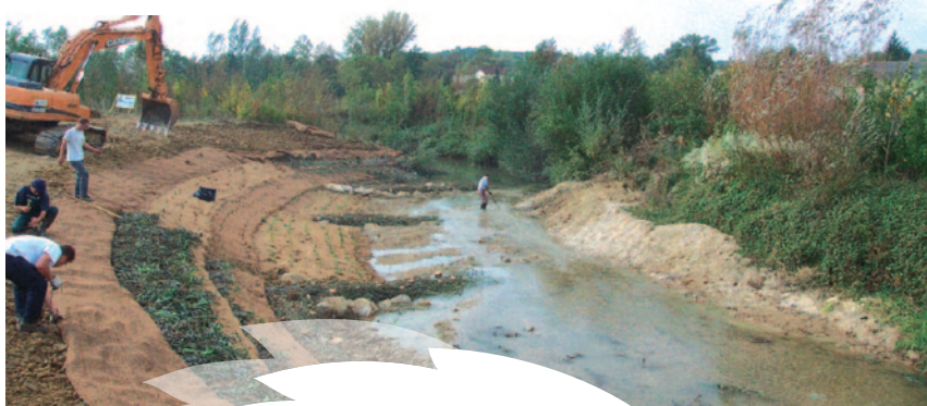
Renaturation du cours d'eau suite à un recalibrage

Dans le cas d'urbanisation très forte de ces zones, un retour en arrière s'avère impossible. Il est donc très important de reconnaître les zones d'expansion de crues et de les protéger à long terme en y réglémentant les constructions.