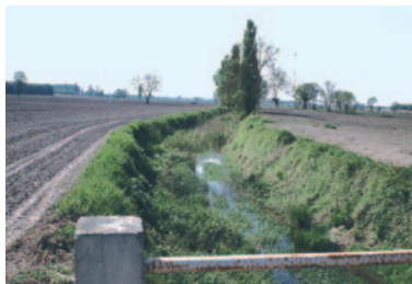
Enfoncement du cours d'eau suite à un recalibrage

La majorité des fonctions assurées par un cours d'eau et sa ripisylve est annulée ; il n'en reste qu'une, l'évacuation des eaux.