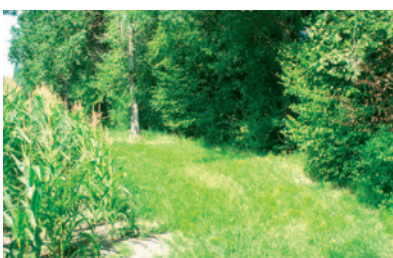
Bande enherbée et ripisylve

La suppression de la ripisylve et l'utilisation des sols à proximité immédiate du cours d'eau sont des cas fréquents de déstabilisation des écosystèmes. L'impact est également fort sur la qualité des eaux.