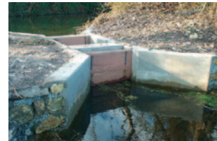
Ouvrage de régulation des niveaux d'eau