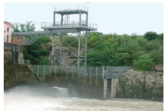
Ascenseur à poissons

La gestion de ces équipements est cruciale car ils doivent être fonctionnels quand le poisson se présente pour limiter au maximum tout retard migratoire. Pour l'ensemble de ces raisons, l'effacement des ouvrages sera préféré chaque fois que cette solution sera envisageable.