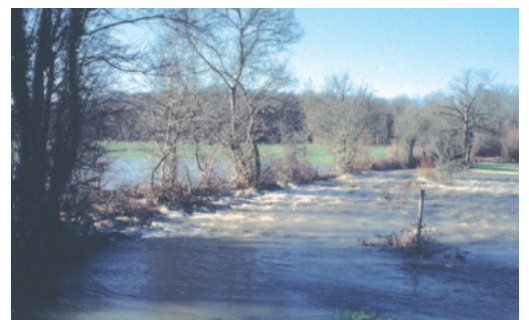
Rôle des haies en période de crue