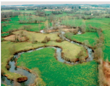
Série de méandres serrés.

Un état non perturbé se caractérise avant tout par un tracé conforme à la dynamique du cours d'eau et l'absence d'aménagement .