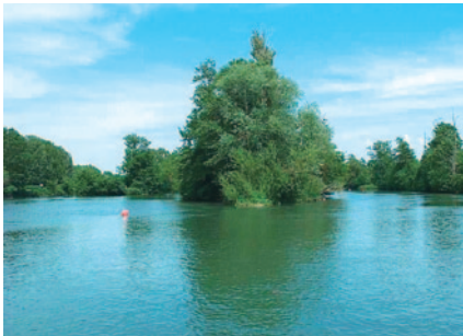
Île sur la Charente

La pente de ces cours d'eau est en général faible (<2%). Ils développent leurs méandres* au sein d'un lit majeur* étendu qui constitue une zone d'expansion des crues* ; ces méandres progressent avec une vitesse lente à très lente, permettant donc de considérer ces cours d'eau comme peu mobiles. Leur recoupement crée des bras morts* qui diversifient les conditions de milieu et évoluent à leur tour vers un comblement progressif.