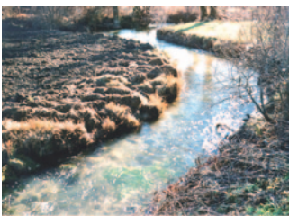
Labour de la berge, culture trop proche du cours d'eau