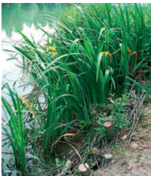
Reconstitution de la ripisylve par tressage de saules et implantation d'iris