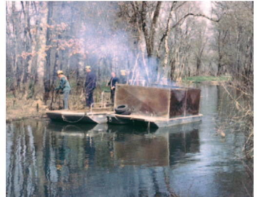
Barge permettant un entretien de la ripisylve depuis le cours d'eau

Un cours d'eau est un milieu dynamique : même en bon état, le suivi par un technicien de rivière est nécessaire. La gestion de la végétation et des embâcles, la sensibilisation des agriculteurs riverains à la protection du cours d'eau et à l'utilité de la végétation sont des actions continues. Les interventions sur le milieu doivent être minimales : un technicien de rivière expérimenté est en mesure de surveiller les points stratégiques du cours d'eau pour n'intervenir qu'à bon escient. L'occupation des sols doit permettre l'inondabilité des secteurs les plus pertinents ; les forêts alluviales et les prairies inondables sont des écosystèmes à préserver.