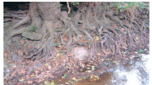
Réseau dense de racines

Le lit majeur des grands cours d'eau est occupé par des forêts alluviales* ou de larges espaces de prairies inondables. Ces prairies sont pâturées de la fin du printemps à l'automne en fonction des niveaux d'eau. Le réseau de canaux et fossés permet une régulation des niveaux d'eau ainsi que le développement de nombreuses espèces : le brochet peut trouver dans ces zones des lieux favorables à sa reproduction et à l'élevage des alevins.