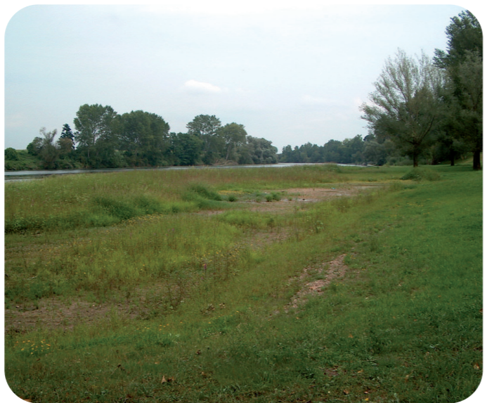
Été - Automne