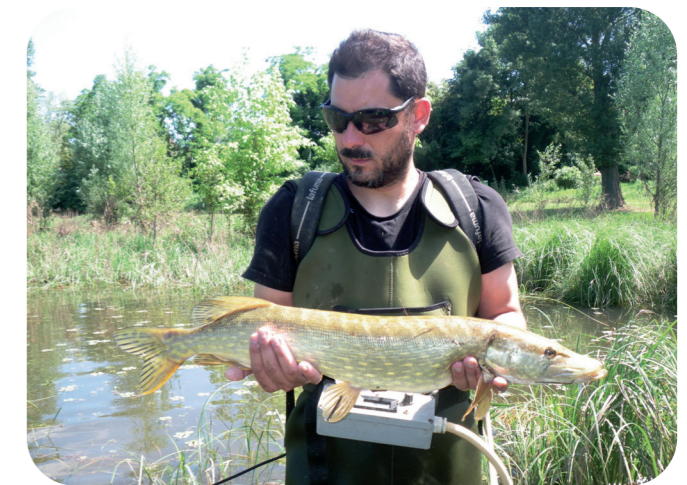
Prise d'un brochet en pêche électrique

L'année de la restauration, d'octobre à janvier, un suivi de la reprise de la végétation herbacée a été réalisé par la FDAAPPMA 47. Le substrat végétal ne s'étant pas assez développé la première année, il a été décidé de mettre en place des frayères artificielles composées de bruyère immergée. Par la même occasion, une surveillance des niveaux topographiques a été menée. Cela représentait une charge de travail d'une demi-journée par mois pour un technicien. De février à juillet, le suivi de la reproduction des différentes espèces piscicoles a été mené. Il comportait une phase d'observation complétée plus tard dans la saison par une pêche électrique d'échantillonnage. Après la période de reproduction, un bilan de l'état physique et de la fonctionnalité vis-à-vis des espèces piscicoles de la frayère a été fait.