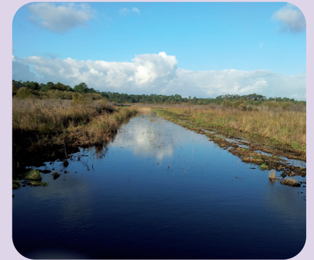
Une mosaïque d'habitats à protéger