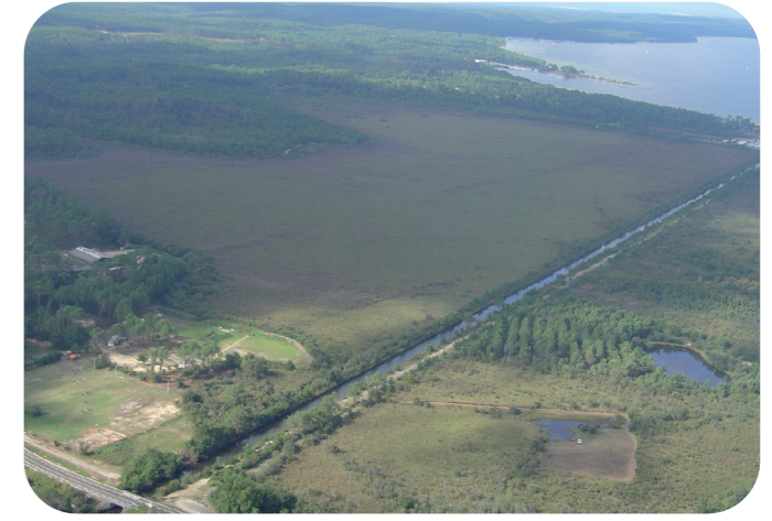
Vue aérienne d'Octobre 2005. La différence de l'évolution de la végétation due au drainage de la partie Est du marais est bien visible.

Les deux étangs sont connectés par le canal transaquitain. Leurs niveaux n'étant pas les mêmes, il existe sur ce canal une écluse, dite de Navarrosse. Elle permet une gestion différenciée du niveau des deux lacs (le lac nord est plus haut que le lac sud). Le marais est alimenté en eau par une buse située en amont de l'écluse et se vidange dans le canal par l'intermédiaire d'une buse située en aval de cette dernière.