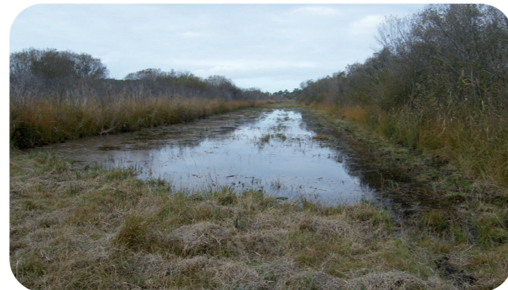
Une des 3 lignes (layons) ouvertes dans le marais pour réaliser les études, notamment topographiques.