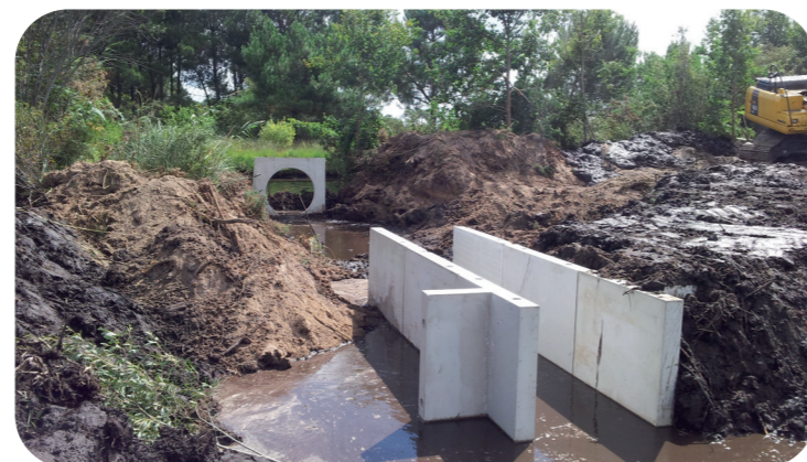
Modification de la buse et installation de la passe à poisson et du seuil.