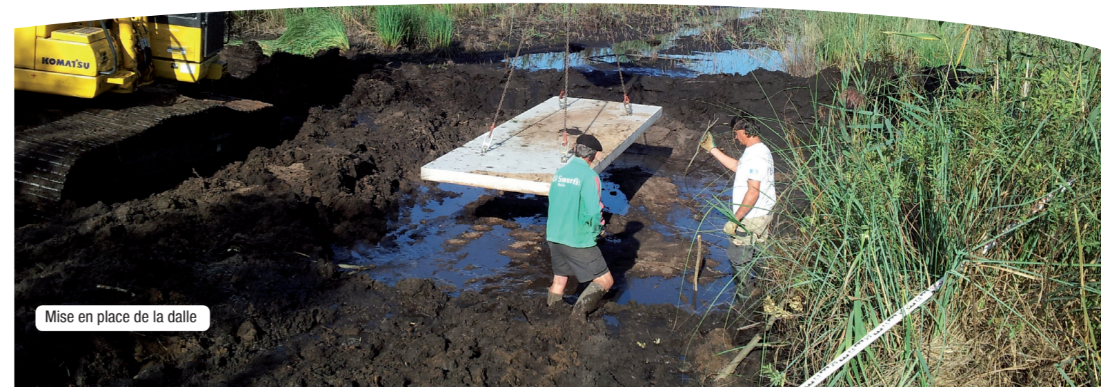
Mise en place de la dalle